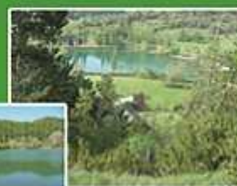
Lac de baignade à Belcaire (5km)

Nombreux parcours accessibles à tous, ballades, randonnées, Parcours VTT - Cyclo / sport